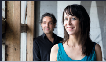
▲ PALIX UND BIENWALD