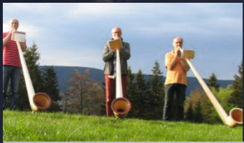
▲ SUHLER ALPHORNBLÄSER